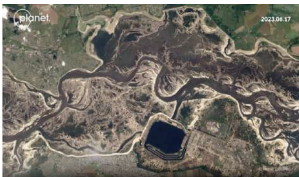
Image of Kakhovka Reservoir and ZNPP with cooling pond June 17, 2023.

La destruction du barrage de Kakhovka a révélé une lacune critique dans la législation internationale et nationale protégeant les infrastructures essentielles à la sécurité de la centrale nucléaire.