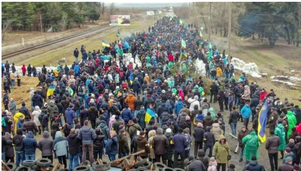
Photo 1. Des civils ukrainiens bloquent la route menant à la ZNPP afin d'empêcher l'occupation russe.

La ville d'Enerhodar, où est implantée la ZNPP, a été prise de force par les forces militaires russes le 4 mars 2022, malgré les protestations de la population civile [Photo 1]. Les forces russes n'ont toutefois pas pris le contrôle de l'ensemble de la région de Zaporizhzhia et, en juin 2025, elles en contrôlent environ 70 % du territoire. 10 Dans ce contexte, la ville d'Enerhodar et la centrale demeurent situées à proximité immédiate de la ligne de front [Figure 1].