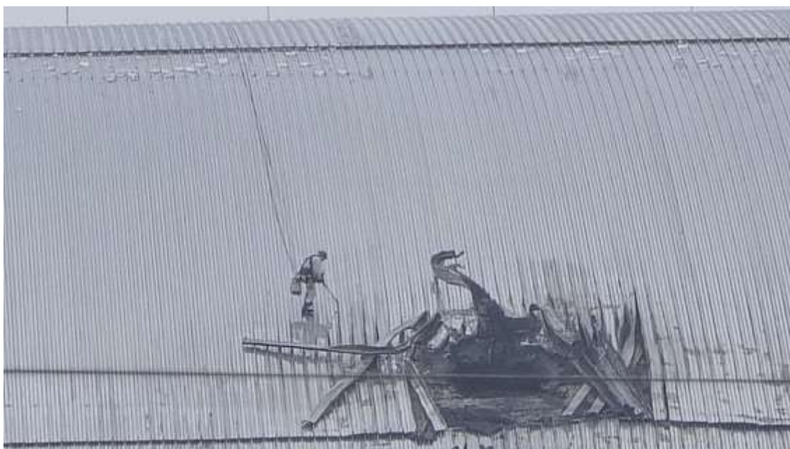
Photo 4: Centrale nucléaire de Tchernobyl endommagée par l'attaque de drone, février 2025.

La montée en puissance de la guerre des drones démontre que, sans investissements urgents dans des garanties juridiques, technologiques et opérationnelles, la sûreté et la sécurité des centrales nucléaires ne peuvent plus être considérées comme acquises.